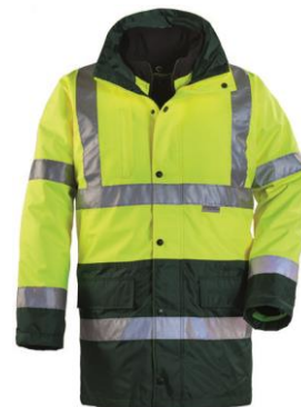
Jaune / Vert