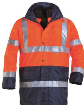
Orange / Bleu