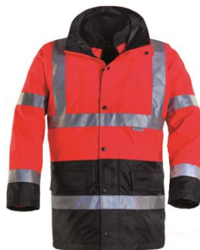
Rouge / Noir