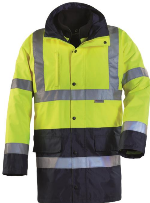
Jaune / Bleu