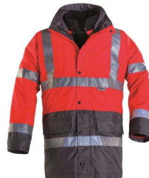
Rouge / Gris